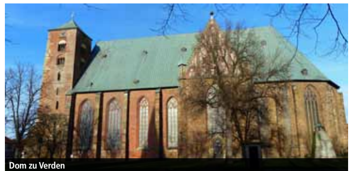
Dom zu Verden

Wir beginnen unsere Radtour mit einem kurzen Besuch des Domes und eines Domherrenhauses. Unsere Fahrt führt uns entlang der Aller zu den Reitstätten. Ein kurzer Besuch in der Reithalle soll uns einen Eindruck der Bedeutung des Pferdeauktionswesens vermitteln. Weiter geht es durch den Stadtwald und die Dünen. Der Sachsenhain, eine alte Thingplatzanlage, und eine Storchenstation sind unser nächstes Ziel. Am Schluss bietet sich die Möglichkeit, das weit über die