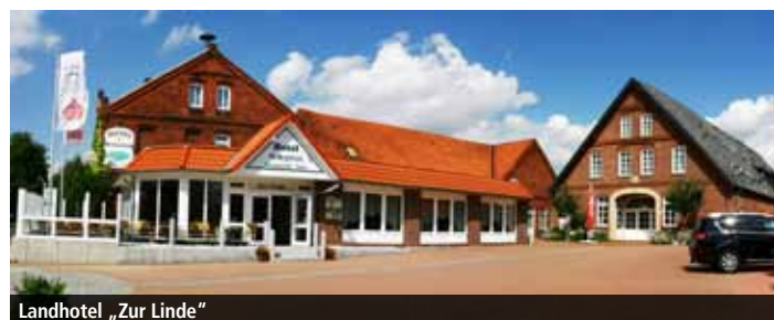
Landhotel „Zur Linde“