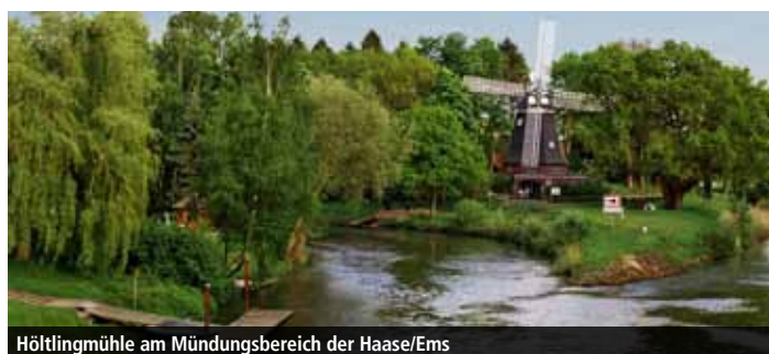
Höltingmühle am Mündungsbereich der Haase/Ems