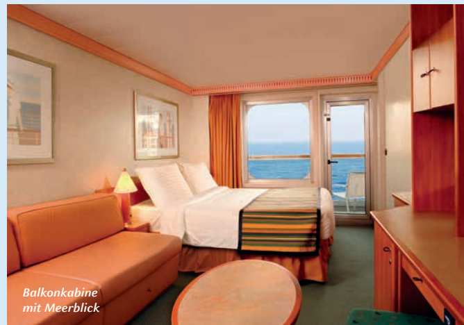
Balkonkabine mit Meerblick