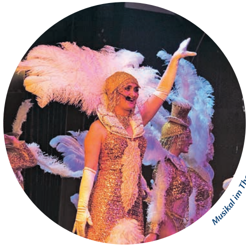
Musikal im Theater-Rex 1932