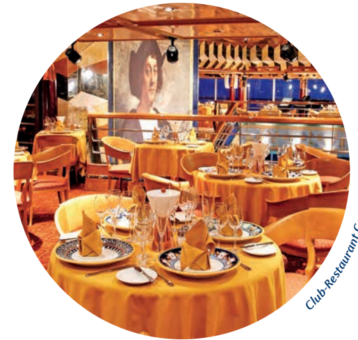
Club-Restaurant Conte Grande 1927