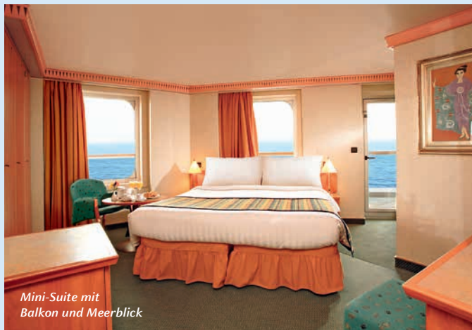
Mini-Suite mit Balkon und Meerblick

Insgesamt 1.358 Kabinen, davon 464 mit privatem Balkon und 58 Suiten mit privatem Balkon