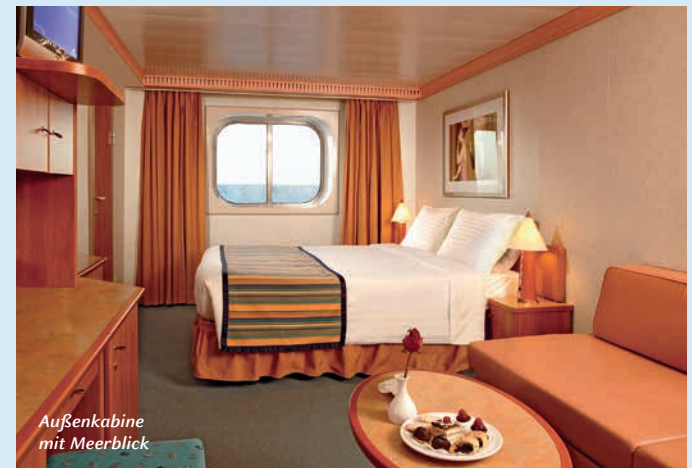
Außenkabine mit Meerblick